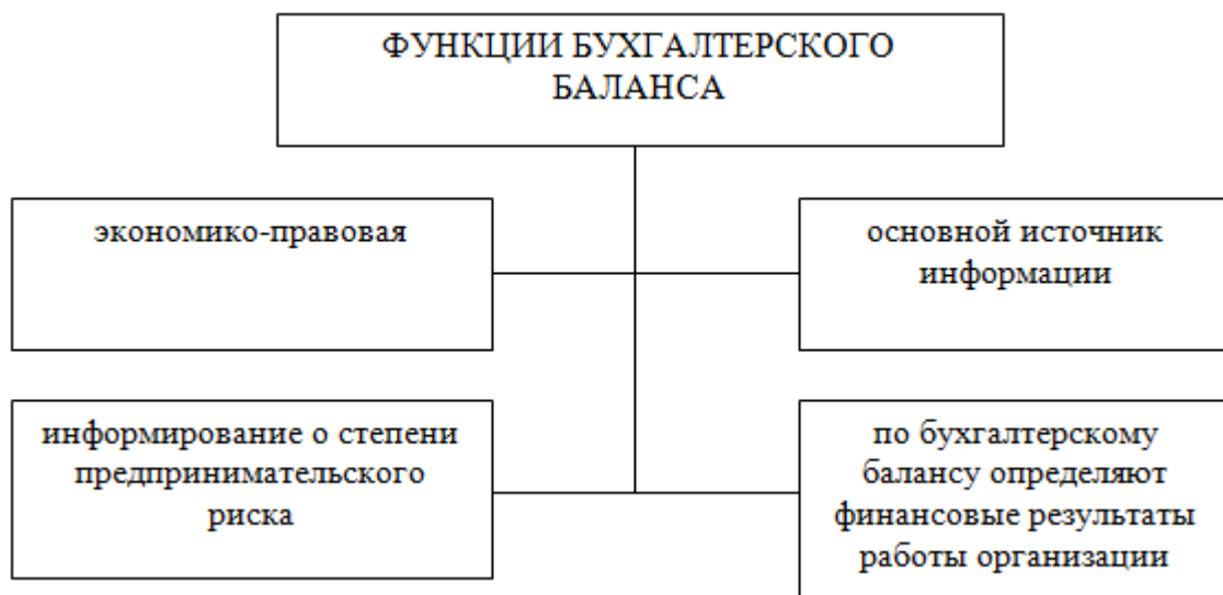
Рисунок 1. Основные функции бухгалтерского баланса

Функции бухгалтерского баланса представлены на рисунке 1.