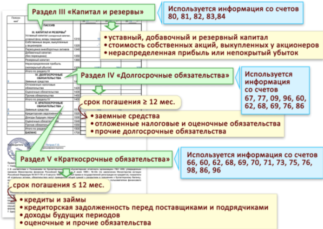
Рисунок 6. Заполнения статей пассива баланса данные по остаткам, сформированным на отчетную дату

Рассмотрим подробнее на примере ООО «Форест Трейд».