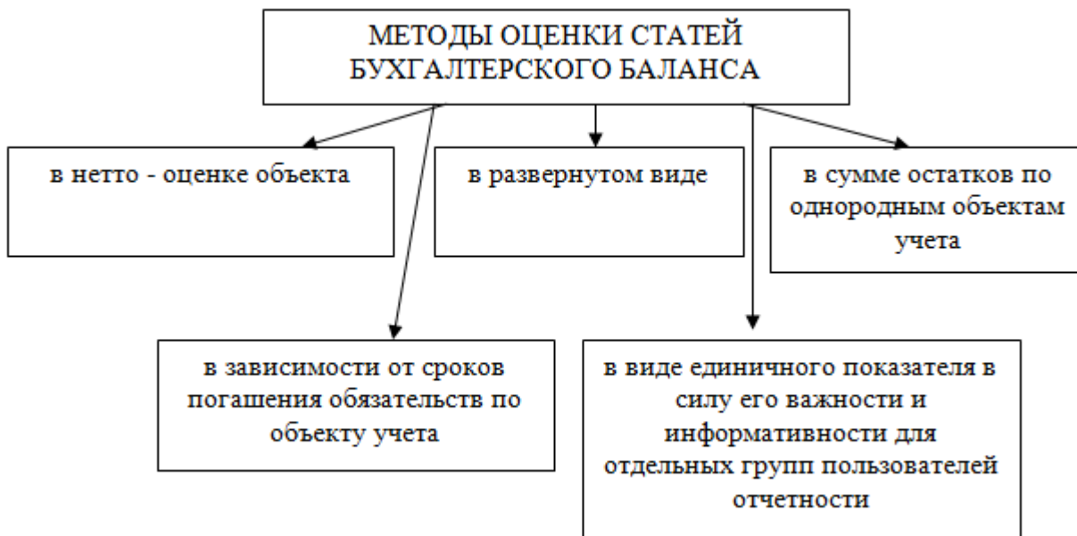
Рисунок 3. Методы оценки статей бухгалтерского баланса

В нетто - оценке приводятся амортизируемое имущество и текущие активы, требующие уточнения своей стоимости из - за постоянно меняющейся внешней среды или форсмажорных обстоятельств. Такими объектами являются задолженность дебиторов, краткосрочные и долгосрочные финансовые вложения, товарно - материальные ценности. По указанным объектам товаропроизводителю разрешено создавать целевые резервы путем их включения в прочие расходы предприятия. В бухгалтерском балансе указывается разность между первоначальной стоимостью таких активов и величиной созданных резервов под сомнительные долги, обесценение вложений в ценные бумаги и снижение стоимости материально - производственных запасов.